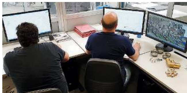
La creatività. Il reparto dove vengono sviluppati i nuovi progetti